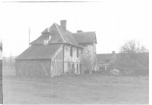
Des vues anciennes du manoir